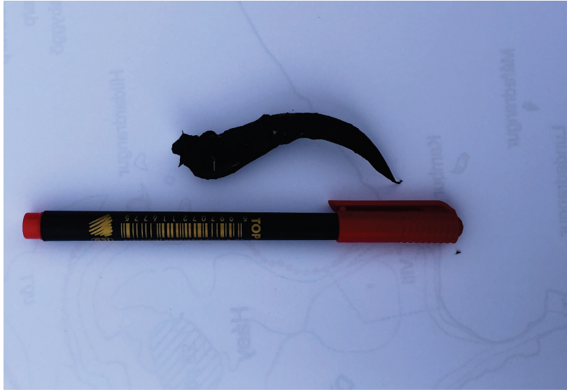
Mynd 2 Nýlega étið undahræ í Lágey og saur úr ref sem fannst þar skammt hjá.